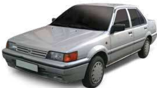
Nissan Sunny 1985

De la première Nissan Sunny vendue en 1985 à la puissante Nissan GTR commercialisée aujourd'hui, en passant par son best-seller, le Qashqai, ABC Motors a parcouru une route vers le succès parsemée d'embûches. La société s'est toutefois toujours armée de force et de détermination afin de maintenir son statut de leader du marché et a, pendant ces 34 dernières années, fait de l'innovation sa raison d'être.