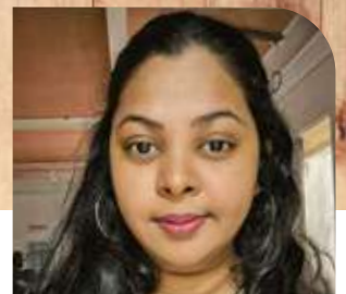
Par Nayesha Sonea , Customs Clearance Office, de SpeedFreight